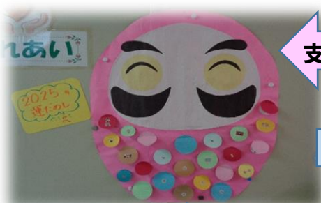
支援員さんによる運だめし