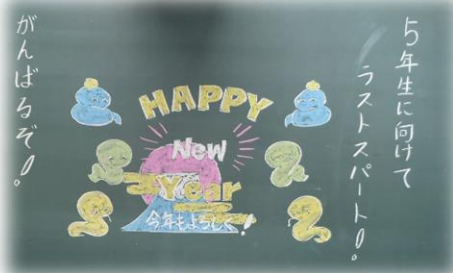
担任の先生方によるおはよう黒板